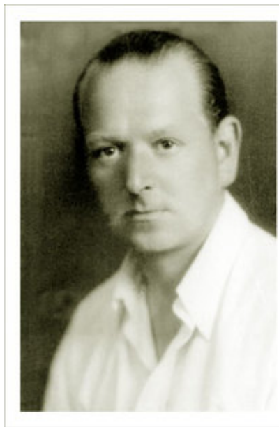
Dr. Edward Bach

यह उच्चतर सत्ता ही है जो करुणामय व्यक्तियों की सहायता करती है।